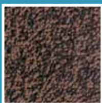
Light brown 2190