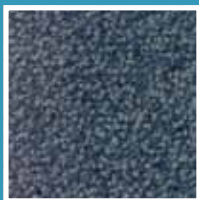
Blue grey 2135

Текстильные тафтинговые маты из сильно закрученной двухцветной нейлоновой нити.