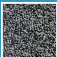
Light grey 2110