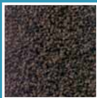
Dark brown 2120