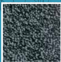
Steel Grey 2160